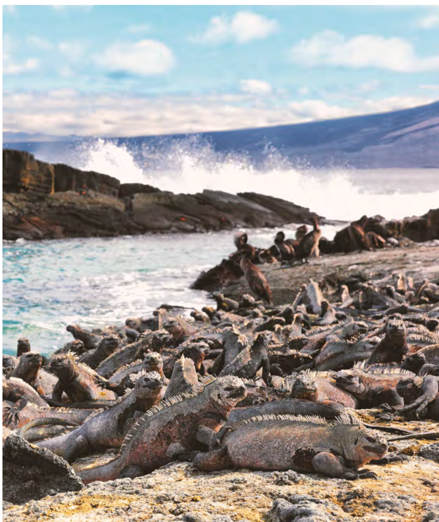
Zeeleguanen liggen te zonnen op Fernandina island