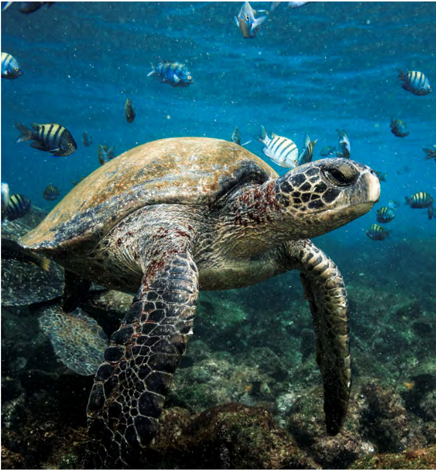
Snorkelen met groene zeeschildpadden in Punta Mangle, Fernandina