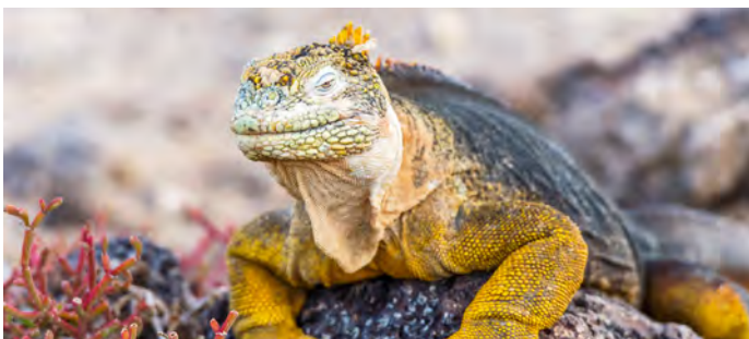
Santa Fe landleguaan

Een prachtig wit koraalstrand wacht op u in het noordelijke deel van het eiland Santa Cruz. Verken Palo Santo, leerbladige en zoute struiken, de thuisbasis van gele mangrovezangers en de cactusgrondvink. Dit is de ideale plek om te zwemmen in turquoise wateren of een ontspannende wandeling langs de kust te maken.