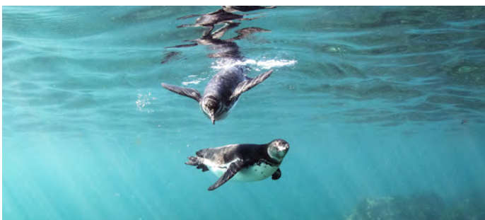
Snorkelen met pinguïns

Dit beschutte inhamgebied, gelegen aan de oostkant van Fernandina, is een uitstekende plek om te snorkelen naast pijlstaartroggen en groene schildpadden. Je krijgt de kans om een wild mangrovebos te verkennen dat wemelt van de pelikanen, Galápagosaalscholvers en de beroemde vinken van Darwin.