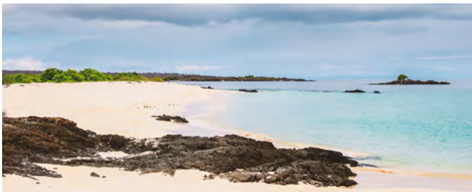
Bahia Borrero, Santa Cruz Island

Bereid je voor om de grootste zeeleguanen van de archipel tegen te komen die op de rotsen liggen zonnen, Galápagos-pinguïns die naar avondeten duiken en flamingo's in hun natuurlijke habitat. Tussen twee actieve vulkanen vormt de zuidkust van het eiland Isabela een oase in een woestijn van lava.