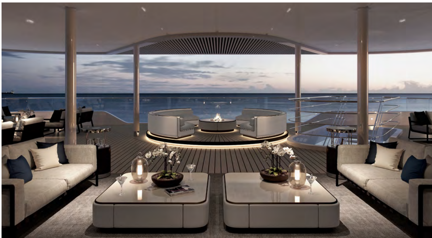
Exterior Explorer Lounge

Het meest elegante schip in de Galápagos