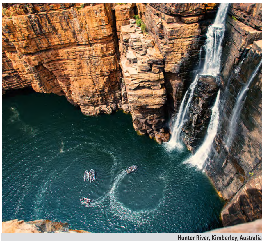
Hunter River, Kimberley, Australia