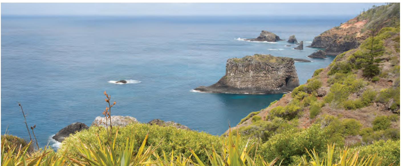
Norfolk Island, Australia